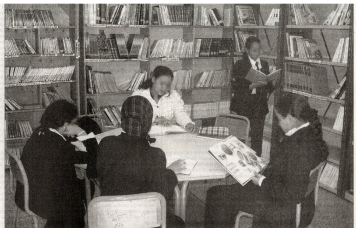
Chaque bibliothèque d'école a nécessité un budget de 25 000 DH.

contribuer à créer un environnement scolaire propice à l'apprentissage. À cet effet, le siège de l'AREF avait abrité le 25 novembre 2010 une réunion pour la mise en place du comité de pilotage. Réunion durant laquelle a eu lieu la distribution de livres aux 10 écoles et à laquelle ont participé les différents partenaires, dont la Librairie des écoles, qui avait accordé des remises substantielles. Au total, près de 20 000 livres choisis par des responsables pédagogiques de l'AREF et destinés aux 6 niveaux du primaire avaient été distribués.